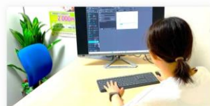
インタビュー 【ベル少額短期保険株式会社様】MICHIRU RPA 企業独占インタビュー

導入企業様のインタビュー記事をホームページにて公開しております。 ぜひご覧ください。