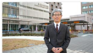
インタビュー 【熊本大学病院様】MICHIRU RPA 企業独占インタビュー